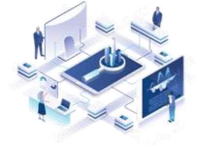
Pengurusan Data Berpusat yang Lebih Efisien