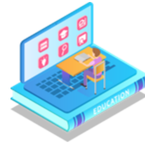
Penggunaan Perisian VDI dalam Aktiviti PdP