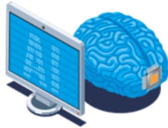
Inisiatif Kecerdasan Buatan