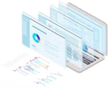
Inisiatif Data Raya