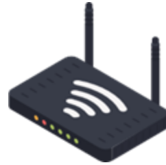
Inisiatif Internet of Things (IoT)