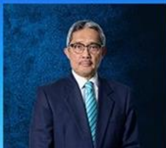
PROFESOR EMERITUS DATO' SRI DAING MOHD NASIR BIN DAING IBRAHIM NAIB CANSOLOR KETIGA 16 MEI 2008 – 15 MEI 2019