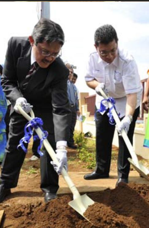
Timbalan Menteri Pengajian Tinggi dan Naib Canselor UMP menanam pokok bucida molinetti ketika melancarkan Kempen Bumi Sihat baru-baru ini.