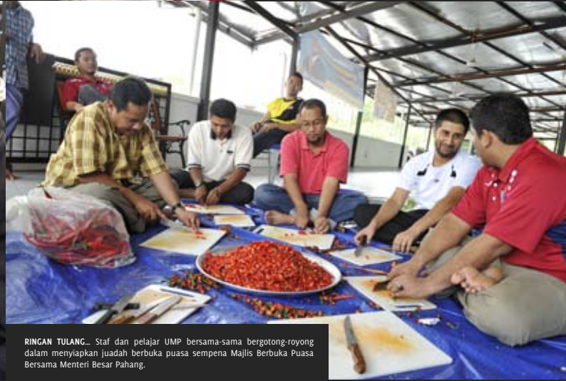
RINGAN TULANG... Staf dan pelajar UMP bersama-sama bergotong-royong dalam menyiapkan juadah berbuka puasa sempena Majlis Berbuka Puasa Bersama Menteri Besar Pahang.