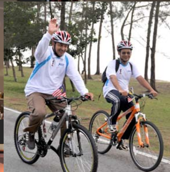
KAYUH _ Pendaftar turut menyahut cabaran mengayuh basikal sejauh 37 kilometer sempena sambutan kemerdekaan negara yang ke-52.