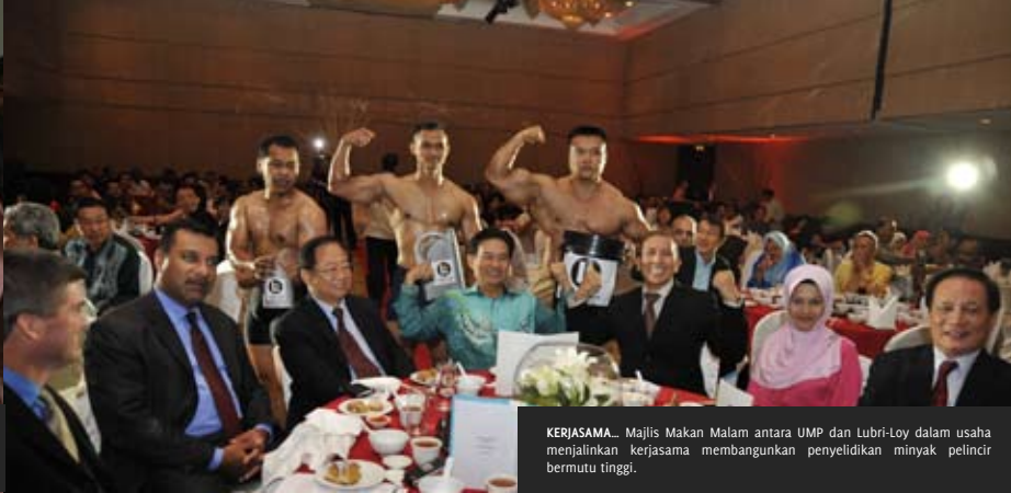
KERJASAMA... Majlis Makan Malam antara UMP dan Lubri-Loy dalam usaha menjalinkan kerjasama membangunkan penyelidikan minyak pelincir bermutu tinggi.