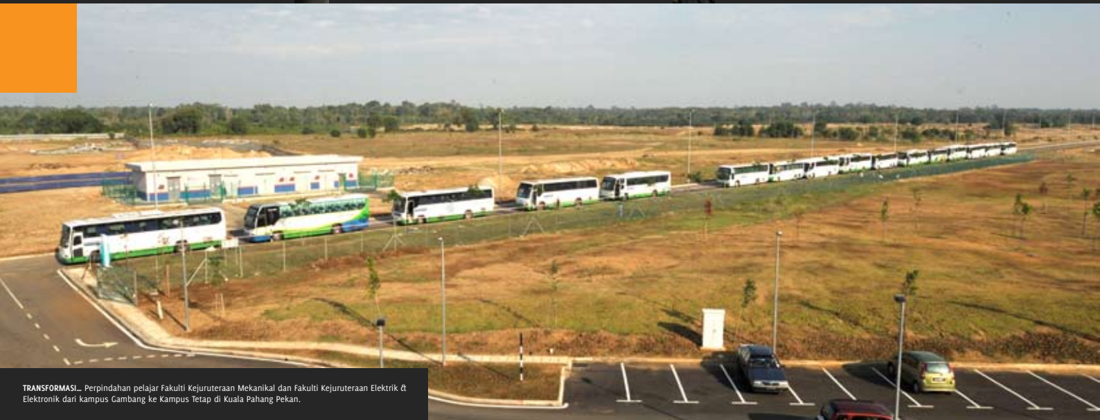
TRANSFORMASI _ Perpindahan pelajar Fakulti Kejuruteraan Mekanikal dan Fakulti Kejuruteraan Elektrik & Elektronik dari kampus Gambang ke Kampus Tetap di Kuala Pahang Pekan.