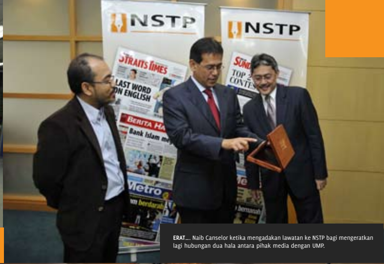
ERAT... Naib Canselor ketika mengadakan lawatan ke NSTP bagi mengeratkan lagi hubungan dua hala antara pihak media dengan UMP.