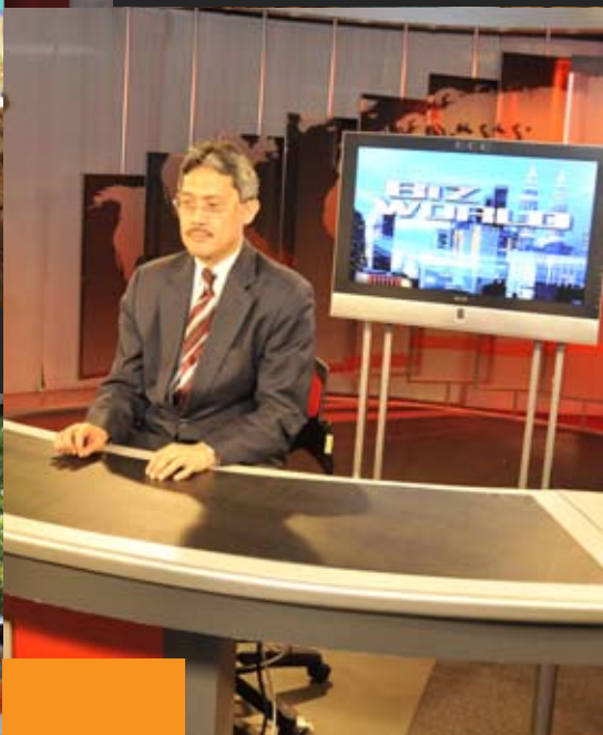
Naib Canselor bergambar kenangan di studio Biz World di TV3 ketika mengadakan lawatan baru-baru ini.