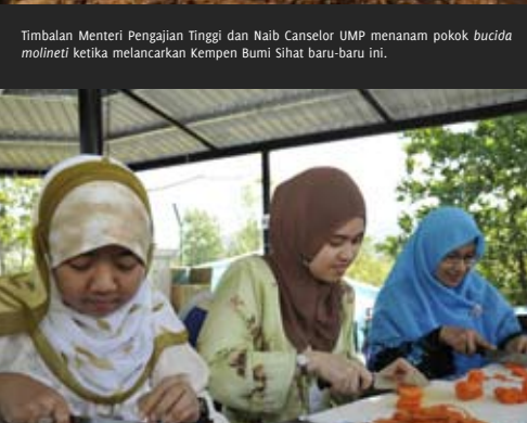
RAJIN _ Staf UMP turun padang bergotong-royong bagi menyediakan juadah berbuca puasa.