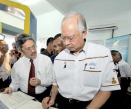
Naib Canselor tekun memerhatikan Perdana Menteri Malaysia menandatangani buku lawatan di booth UMP bersempena program MSC Malaysia Pahang.