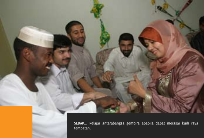
SEDAP... Pelajar antarabangsa gembira apabila dapat merasai kuih raya tempatan.