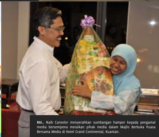
RAI _ Naib Canselor menyerahkan sumbangan hamper kepada pengamal media bersempena meraikan pihak media dalam Majlis Berbuka Puasa Bersama Media di Hotel Grand Continental, Kuantan.