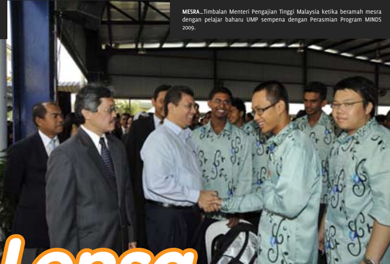
MESRA... Timbalan Menteri Pengajian Tinggi Malaysia ketika beramah mesra dengan pelajar baharu UMP sempena dengan Perasmian Program MINDS 2009.