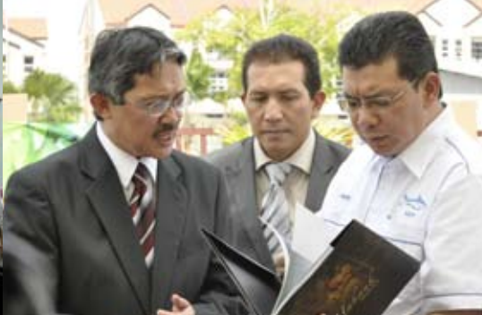
BERMINAT _ Timbalan Menteri Pengajian Tinggi meneliti buku Haknuk yang diberikan oleh Naib Canselor sempena Academic Carnival dan Expoconvo'09 UMP.