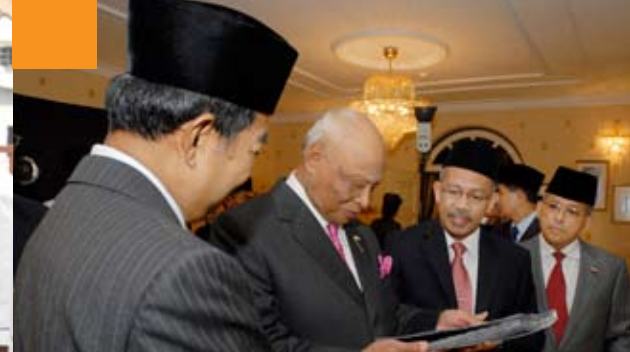
TELITI _ KDYMM Sultan Pahang meneliti mock-up buku "The Ruler, The Builder, The Engineer" terbitan Penerbit UMP.