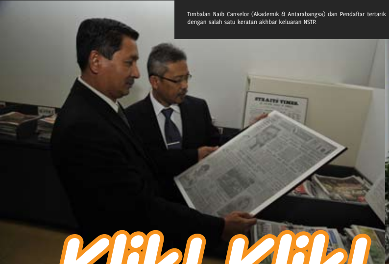
Timbalan Naib Canselor (Akademik & Antarabangsa) dan Pendaftar tertarik dengan salah satu keratan akhbar keluaran NSTP.