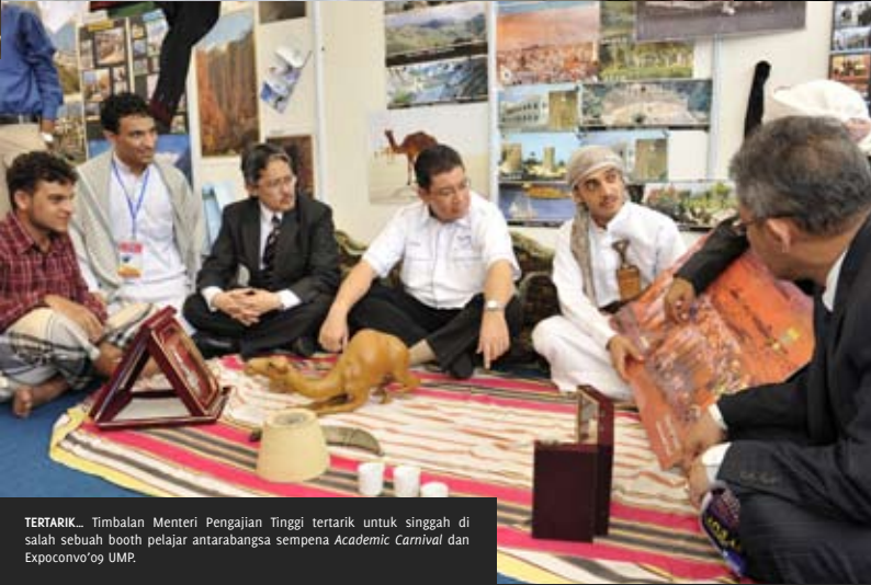
TERTARIK... Timbalan Menteri Pengajian Tinggi tertarik untuk singgah di salah sebuah booth pelajar antarabangsa sempena Academic Carnival dan Expoconv0'09 UMP.