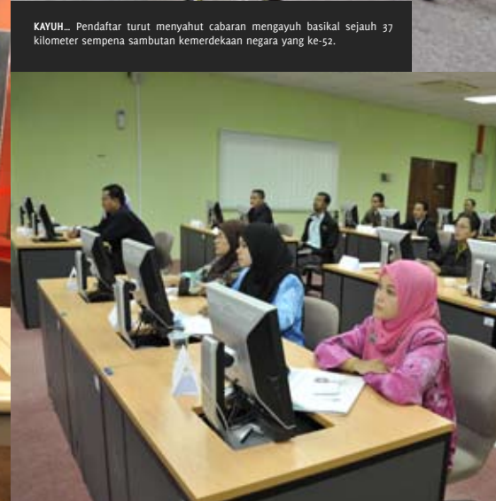
TEKUN _ Antara peserta yang hadir bagi mendengar taklimat Kursus ACL anjuran Unit Audit Dalam.